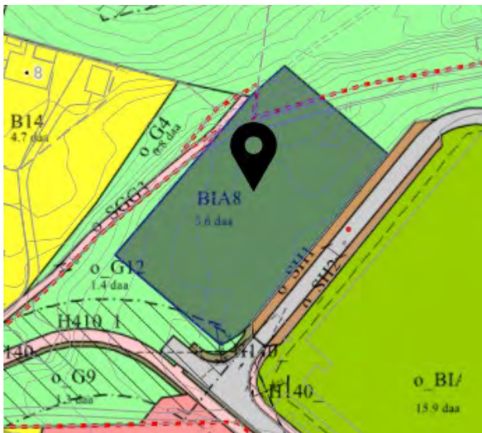
Utsnitt 2011004 Områderegulering for Randaberg sentrum øst.

Mot sørvest, nordvest og nordøst grenser området til friområder samt delvis til en gangsti langs nordvest, mot sørøst avgrenses området av Torvmyrveien med kollektivholdeplasser.