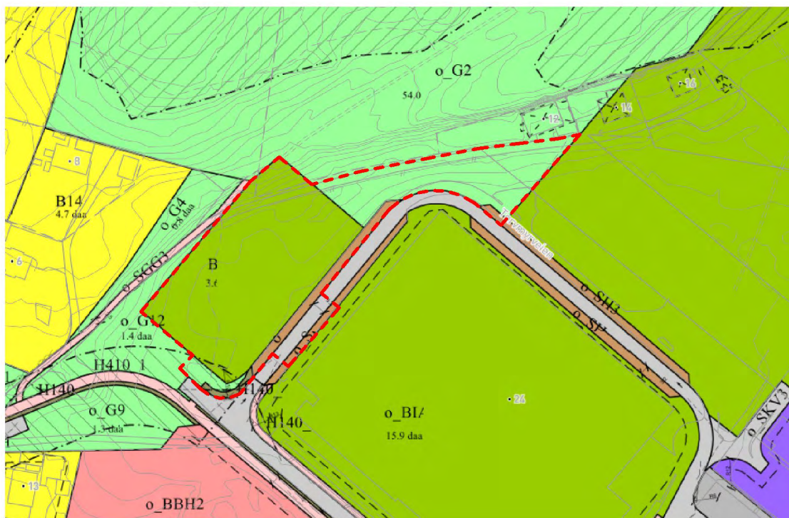
Figur 1 Forslag planavgrensning