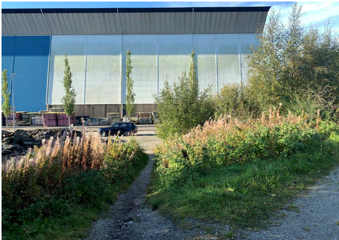
Figur 2 Sti fra Torvmyrveien til Odnabergveien