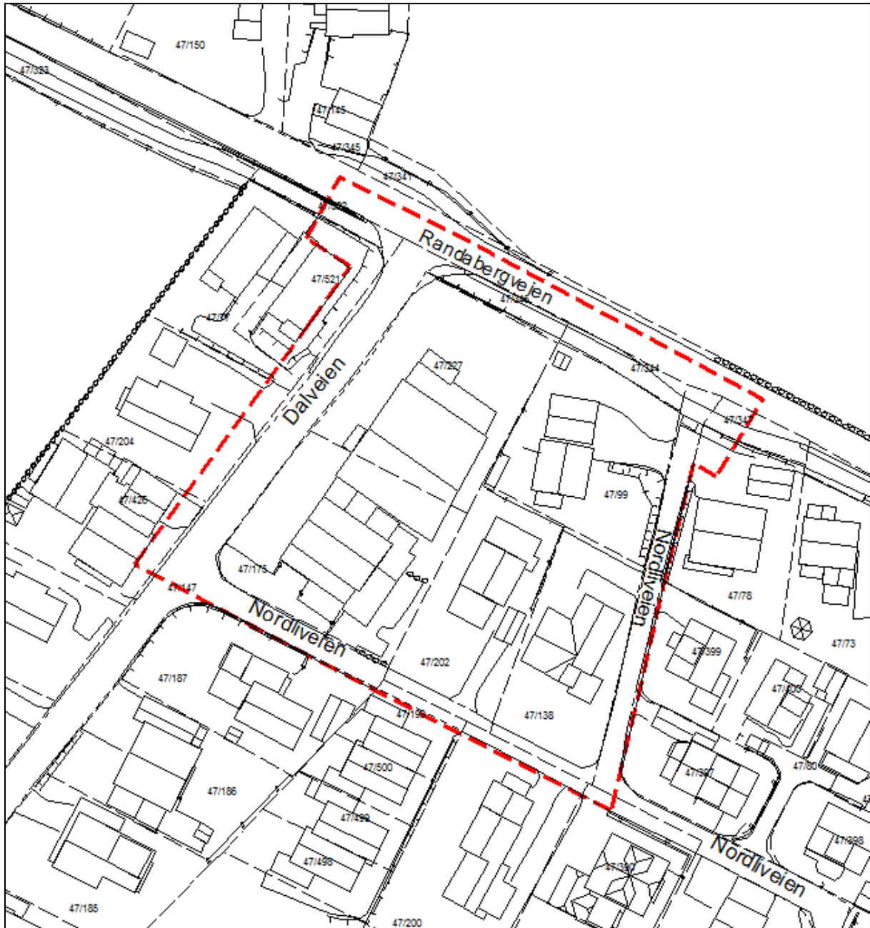
Planavgrensning vist med rød stiple linje

Planområdet avgrenses mot Randabergveien i nord, Dalveien i øst, Nordliveien i sør og vest (vurdere fortau på vest-/østsiden av Dalveien):