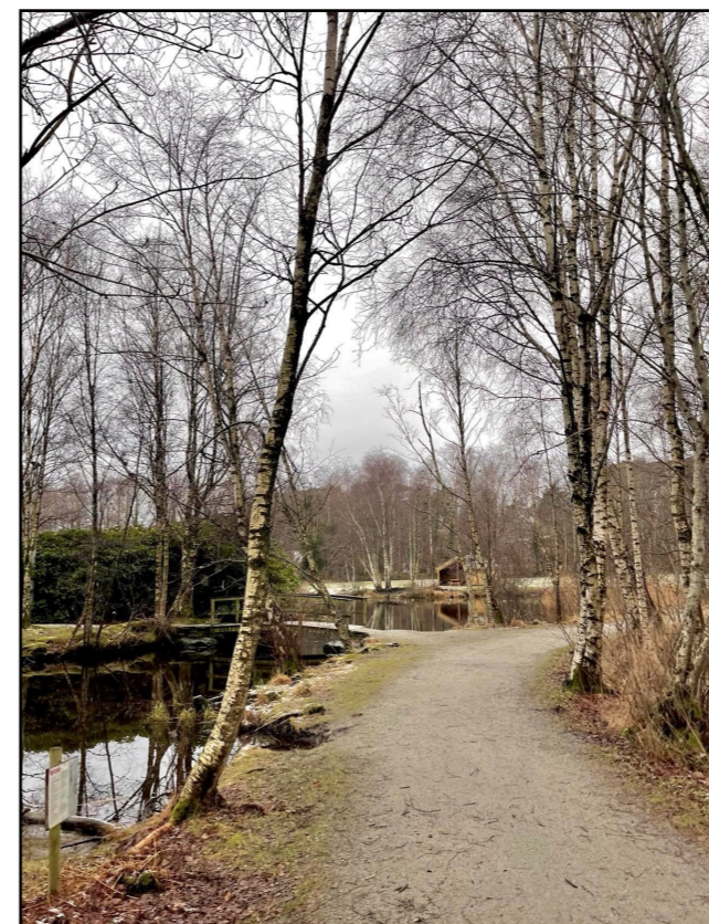
Et fint bilde fra rundt Myrå.