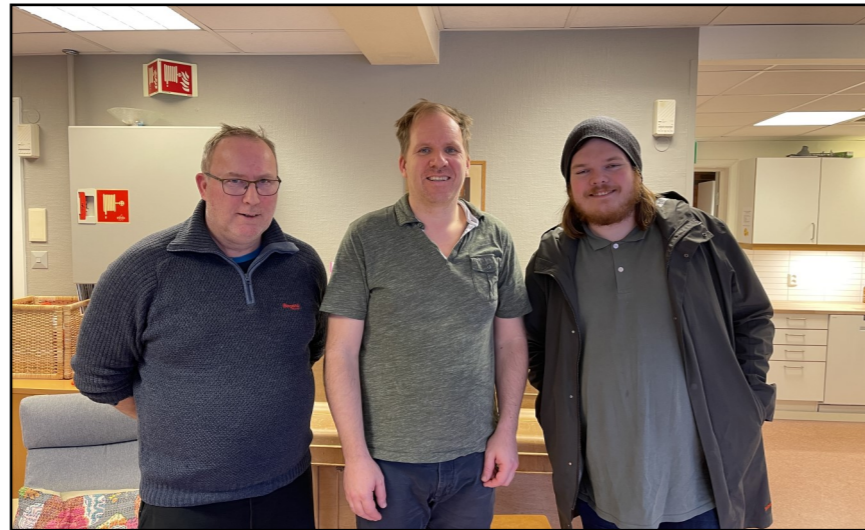
Påskekrim med Simen Side 3