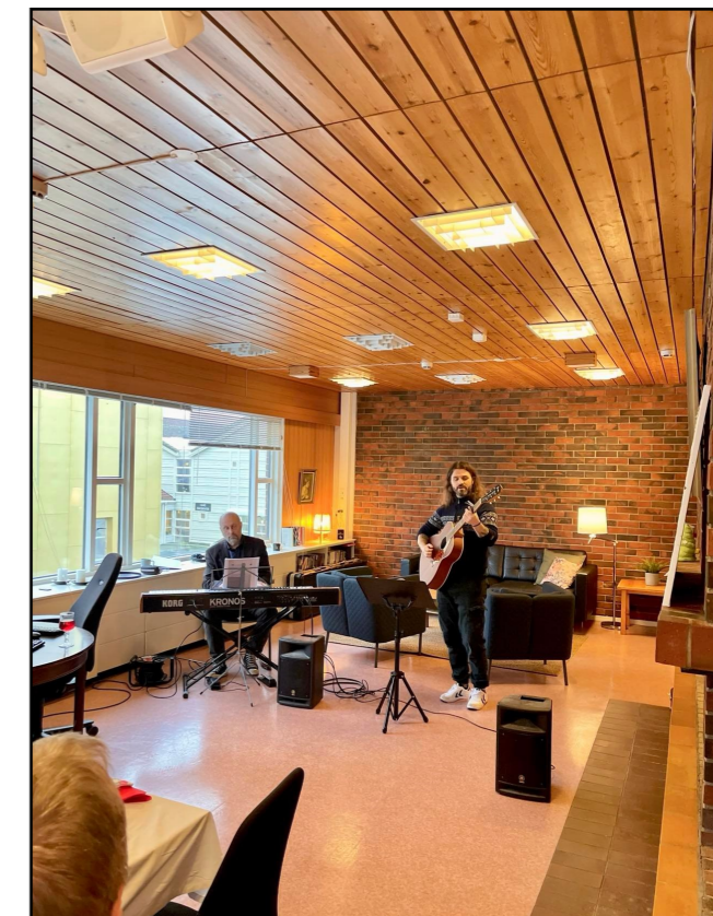
Bilde av nydelig live musikk som ble spilt for oss på julebordet.