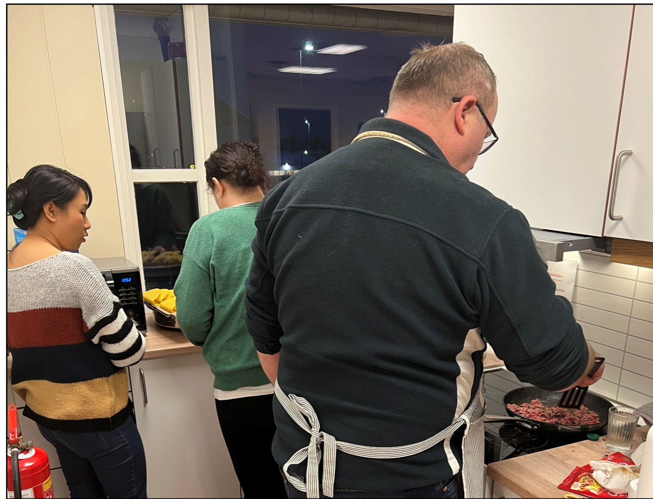
Her forberedes det til taco.