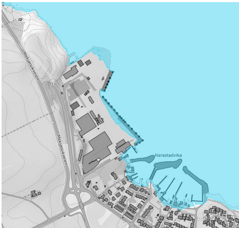
Figur 3 Stormflo

Planforslaget legger ikke opp til bebyggelse på utfyllingen. Det tilrådes allikevel at det ved videre utvikling og prosjektering av dette planområdet vurderes behov for tiltak/barrierer for å redusere påvirkningen av stormflo og bølger for de eksisterende bygningene som omfattes av planområdet. Det bør da også gjøres en vurdering av bølgepåvirkning, slik at det beregnes en samlet høyde for fremtidig havnivå, herunder stormflo og bølgepåvirkning. Gitt dette vurderes planområdet og tiltaket som lite sårbart for stormflo.