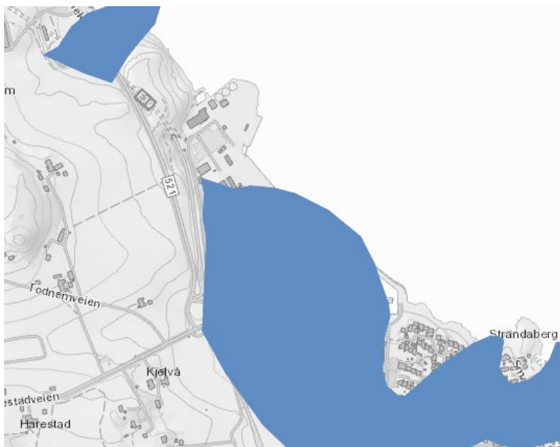
Figur 2 Marin strandavsetning

Det er ingen registrerte kvikkleiresoner i eller i relevant avstand til planområdet (NVE Atlas). Planområdet ligger imidlertid under marin grense hvor kvikkleire kan forekomme. Områder under marin grense vurderes som aktsomhetsområder for marin leire (NVE Atlas). Kartgrunnlag fra NGU (løsmasser) viser at det er marin strandavsetning i deler av planområdet (figur 2).