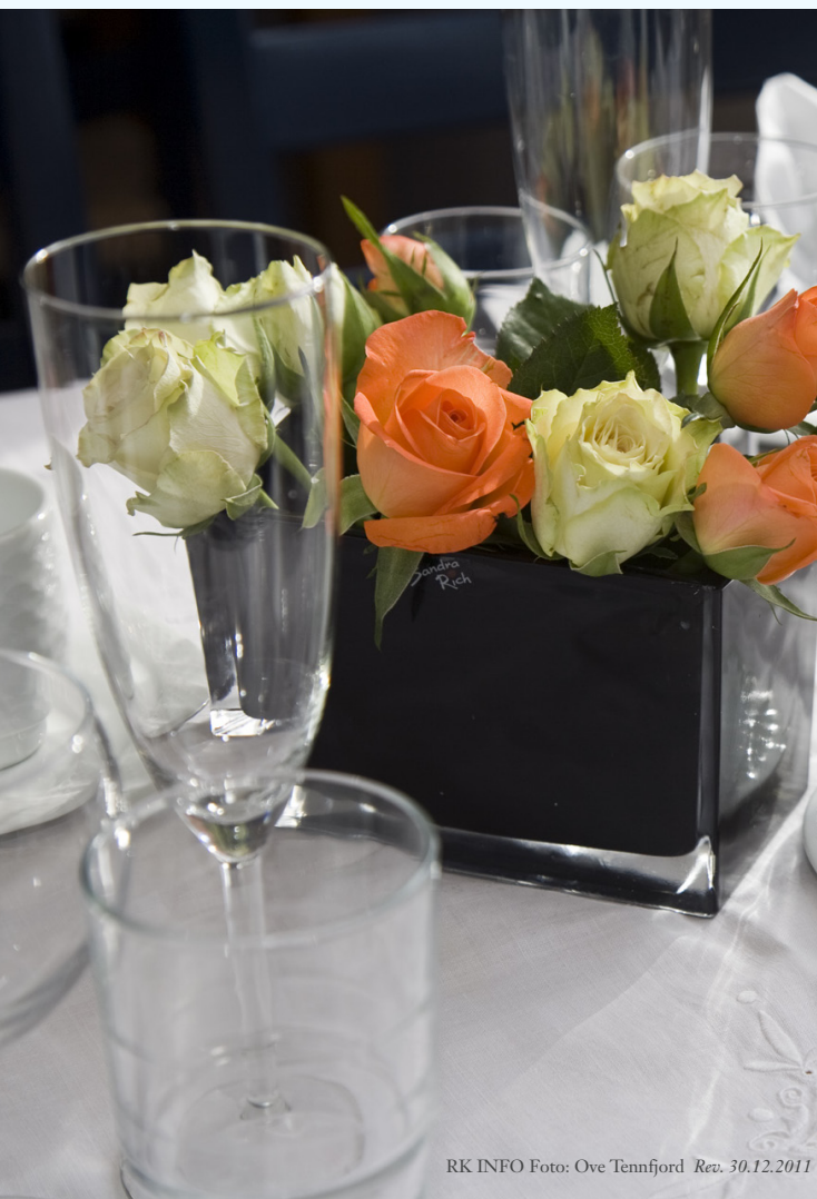
RK INFO Rev. 30.12.2011

Ta kontakt med servicetorget i Randaberg kommune, tlf 51 41 41 00, dersom du ønsker omvisning utenom åpningstiden.